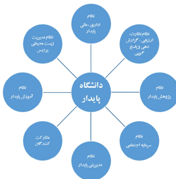
شکل 3: نمایی از ابعاد دانشگاه پایدار