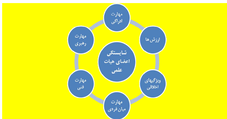
نمودار 2: مدل شایستگی‌های محوری اعضای هیئت علمی

در نهایت با توجه به شایستگی‌های محوری و سازه‌های آنها، مدل شایستگی اعضای هیئت علمی دانشگاه تدوین شد که در نمودار 2 به طور خلاصه و در نمودار 3 به طور جامع قابل مشاهده است.